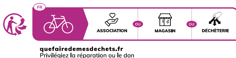
Format bloc – Block format