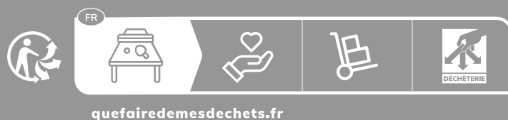
Format bloc – Block format