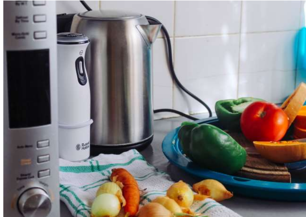
Photo disponible en banque d'images avec équipements électriques de cuisine ou autre photo au choix de la collectivité

Selon les chiffres de 2016 d'une étude IPSOS pour Ecologic, on trouve en moyenne 118 équipements électriques et électroniques dans une maison, 73 dans les appartements pour une moyenne nationale de 99 équipements. On imagine que la tendance n'est pas à la baisse depuis 2016. Pour tout savoir sur les bons réflexes : [lien vers bon article Ecologic]