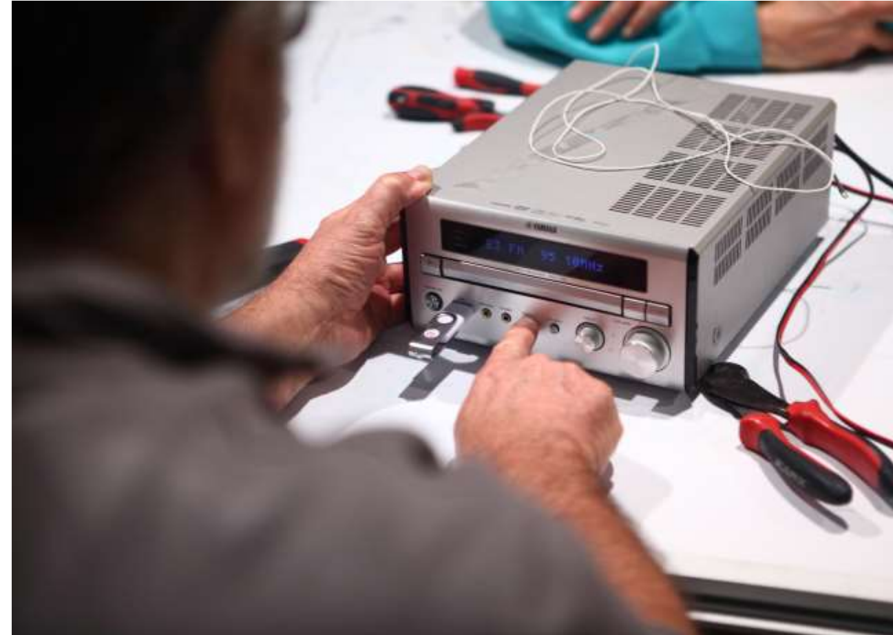
Photo au choix en banque d’images Ou Photo d’atelier local de réparation

Des professionnels réparateurs n’attendent que vous pour redonner vie à vos équipements, pensez-y !