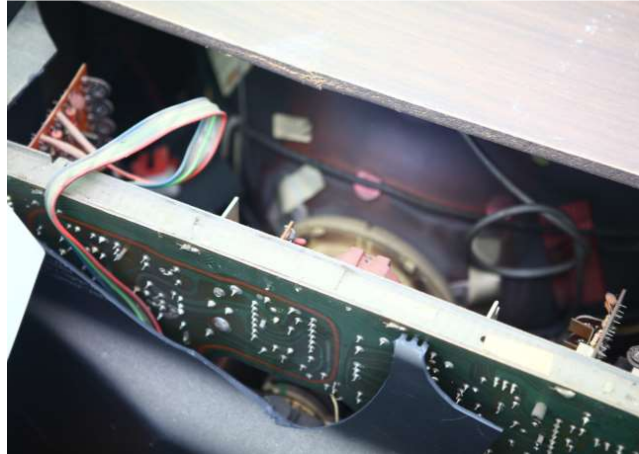
Photo au choix en banque d'images Ou Photo dans une recyclerie avec interaction entre un vendeur et un consommateur