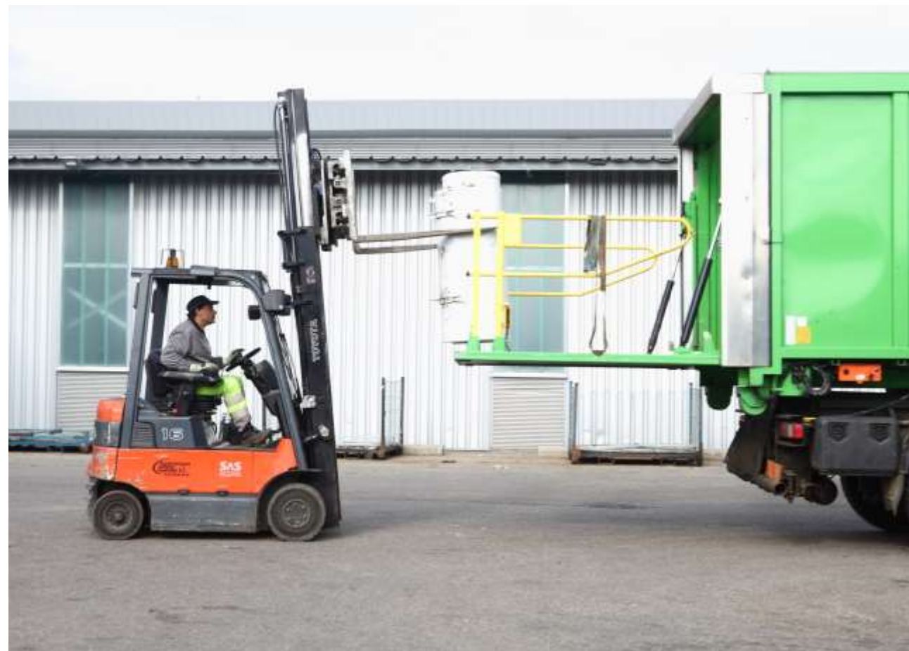
Photo au choix en banque d'images Ou Photo de réemploi / recyclage en contexte local

Pour aller plus loin sur la réduction des déchets, [valoriser un article ou une initiative (ex : une animation de la ville) autour du zéro déchet).