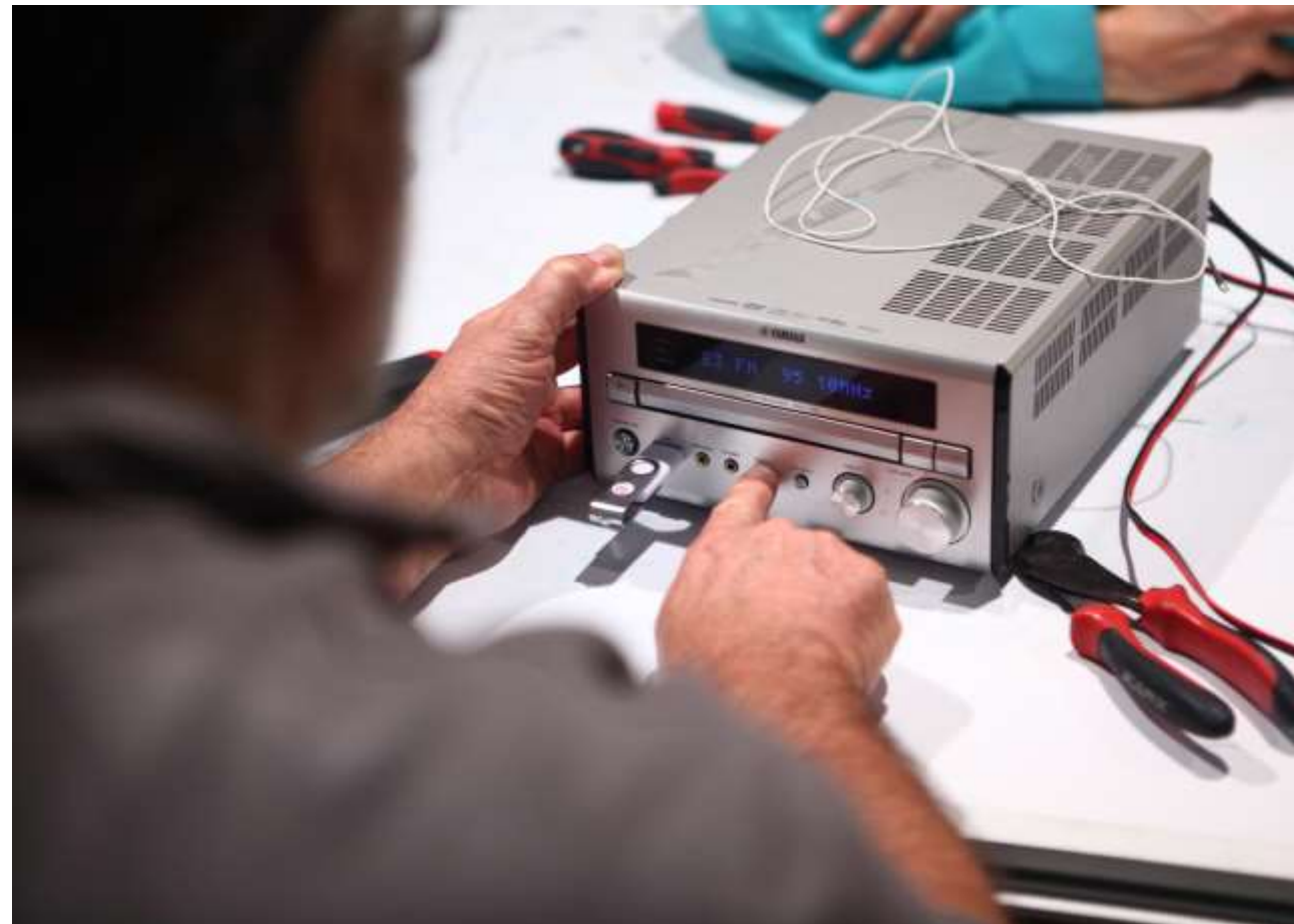
Si possible, photo d'un réparateur de terrain.

Retrouvez ici toutes les infos sur le soutien à la réparation : www.ecologic-france.com