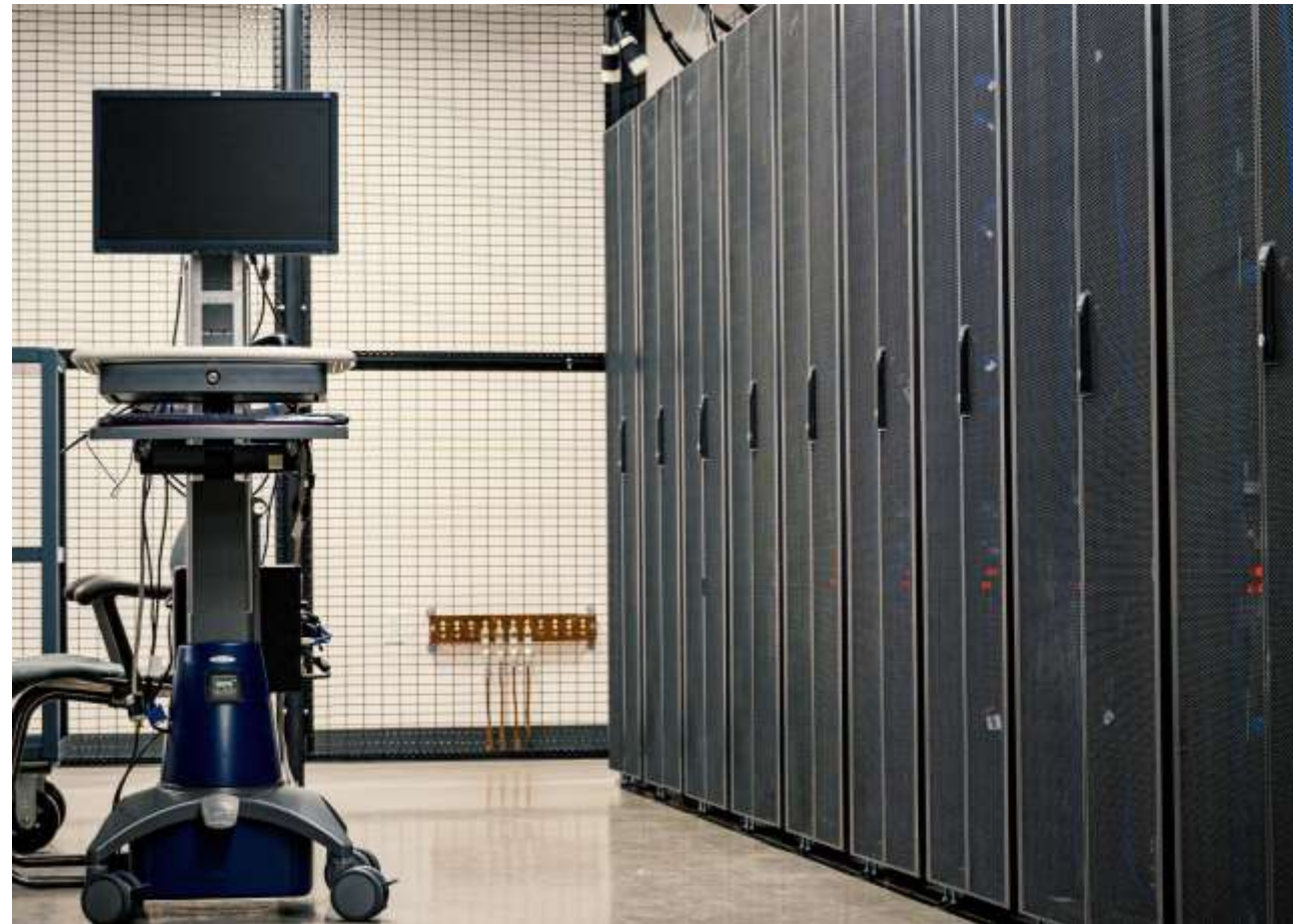
Photo de serveurs de données disponible en banque d'images