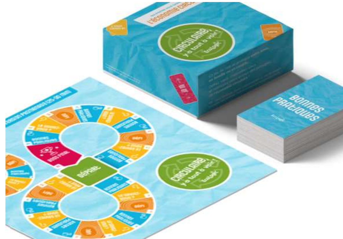
Photo du jeu de l'oie CIRCULAIRE, Y A TOUT A VOIR ! (disponible dans la banque d'images) Ou (si disponible) Photo du jeu avec des animateurs de votre collectivité

[Prénom des animateur.trices] seront avec vous pour vous donner toutes les infos et surveiller votre fair-play !