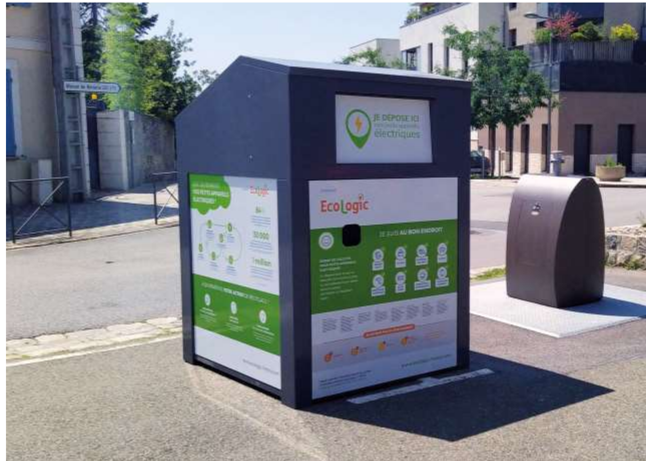
Photo d'un contenant avec consignes sur les EEE (exemple disponible en banque d'images)

On observe que les 3 équipements les plus mal triés sont : les chargeurs de téléphone ou d'ordinateurs (au moins 10 millions d'unités par an ), les périphériques informatiques (souris, clavier, clé USB, etc.) avec 9,4 millions d'unités et le petit éclairage (lampe de poche, guirlande...), avec 4,2 millions d'unités.