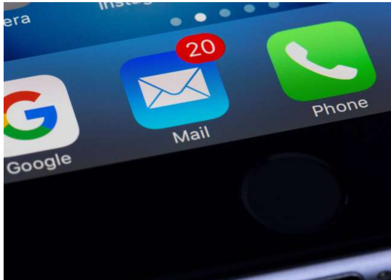
Photo au choix en banque d'images Ou Photo avec plein de téléphones dans un tiroir

Pour en savoir plus sur nos blocages autour de ces petits appareils, retrouvez les 7 raisons qui nous empêchent de nous séparer (à tort !) de nos anciens téléphones : [lien vers article Ecologic étude]