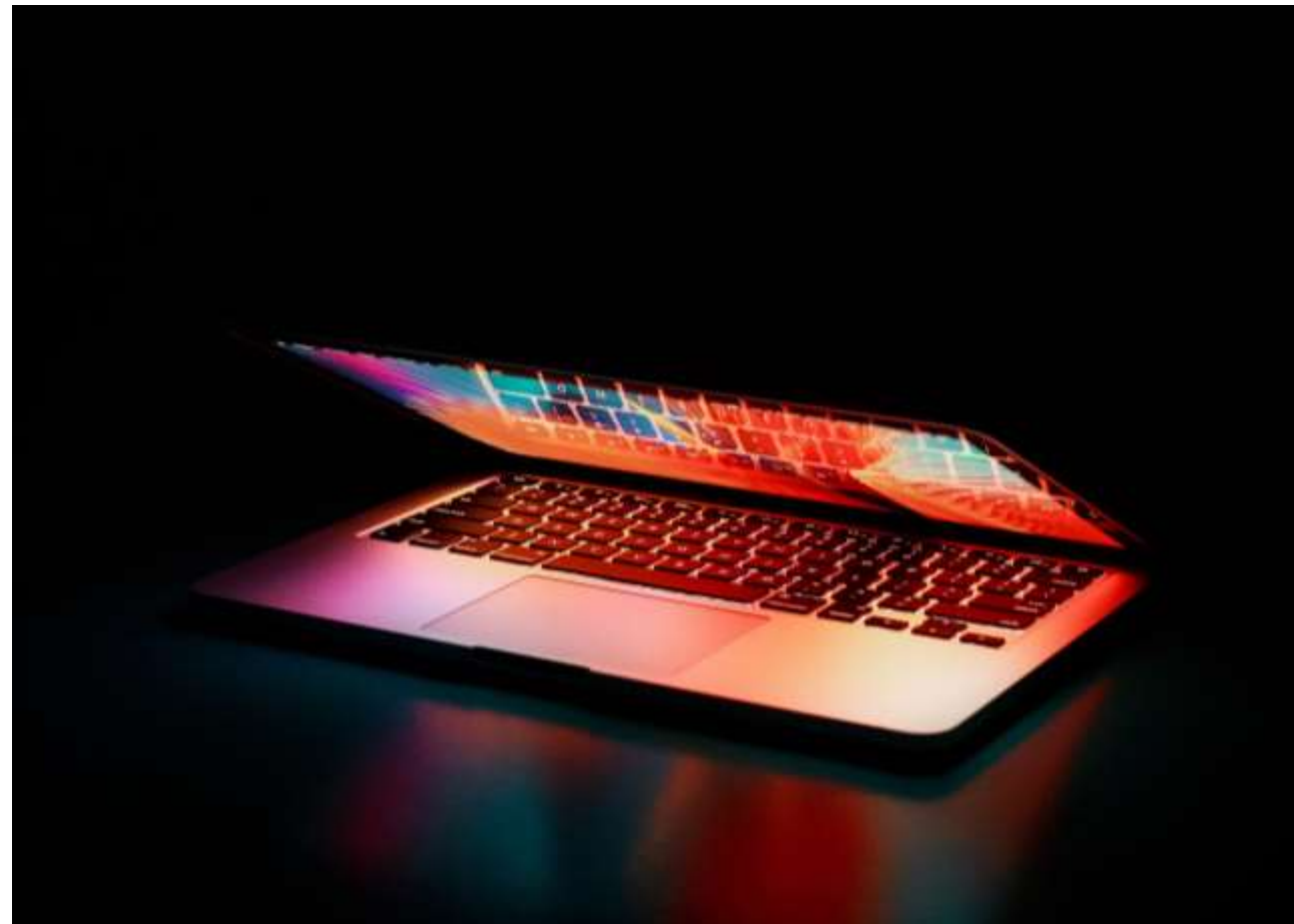
Photo au choix en banque d'images Ou Une personne en train de baisser le capot de l'ordinateur portable